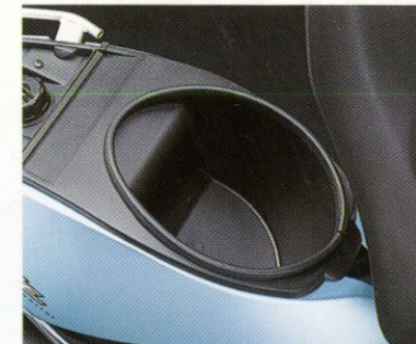
Der Estilete befreit von unnötigem Ballast, wenn Sie mal ohne Scooter unterwegs sind: im großen Staufach findet sicher abgeschossen, z. B. der Helm seinen Platz.

Wer mehr will als den Durchschnitt, der muß den Mut zum Außergewöhnlichen haben. Und den Wunsch, den anderen immer ein klein wenig voraus zu sein. Mit dem SUZUKI UF 50 Estilete ist das Alltag. Und das, obwohl er selbst alles andere als Alltag bietet. Denn bei diesem Szene-Scooter kann sich nicht nur die Optik sehen lassen. Auch technisch scheint der neue Maßstab der 50er-Klasse aus der Zukunft zu kommen.