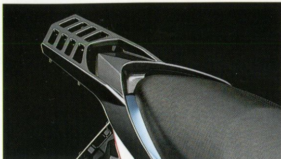
Der als Originalzubehör erhältliche Gepäckträger paßt sich optisch perfekt an die messerscharfe Linie des UF 50 Estilete an und schafft zusätzliche Transportmöglichkeiten.